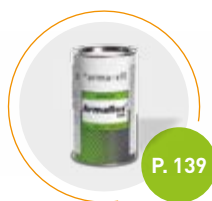
Colle Armaflex HT625