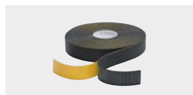
TAPE Tape auto-adhésif