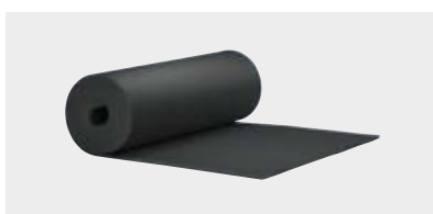
ROULEAUX Plaques en rouleau